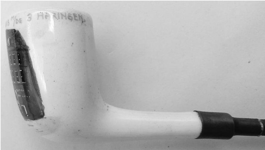
Afb. 6a-c. De handbeschilderde gegoten pijp. Hoogte van de kop 4,7 cm; steellengte 30 cm. (collectie auteur)