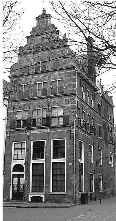
Afb. 1. Het uithangbord aan de voorgevel