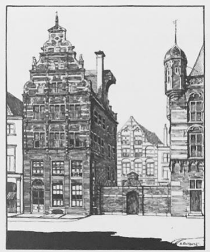
Afb. 3. Voorstel voor een verbinding tussen het huis (links) en de waag uit 1925 ( uit het waardestellend rapport, p. 32)